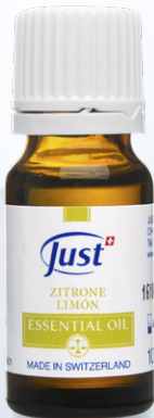
ACEITE ESENCIAL LIMÓN Notas refrescantes y propiedades energizantes. 10 ml