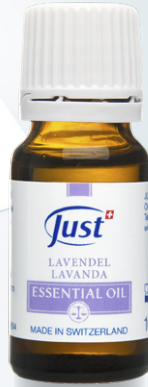
ACEITE ESENCIAL LAVANDA Sugestivas notas olfativas que evocan calma y serenidad. 10 ml