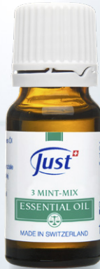
ACEITE ESENCIAL MENTA Sinergia de menta para favorecer la frescura y la concentración. 10 ml