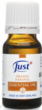
ACEITE ESENCIAL NARANJA Dulzura y positividad inspiradas en frutas mediterráneas. 10 ml