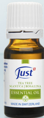
ACEITE ESENCIAL TEA TREE Fórmula altamente calmante y purificante. 10 ml